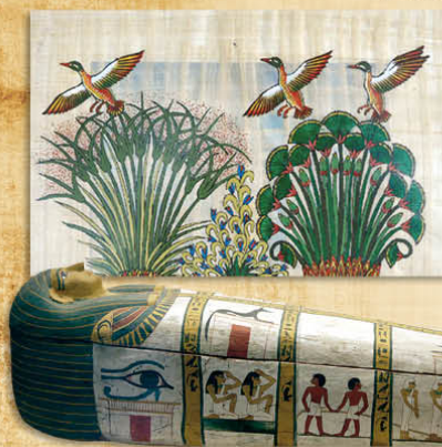
Égypte - Sarcophage II e millénaire