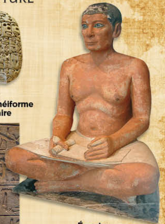
Égypte Le "scribe accroupi" III e millénaire