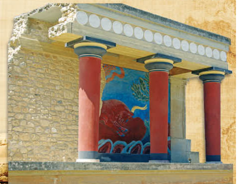
Palais de Cnossos - Crète III e /II e millénaires