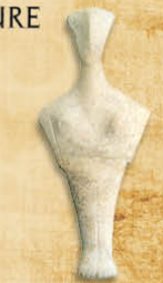
Les Cyclades Statuette féminine III e millénaire