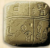
Sumer Écriture pictographique IV e millénaire