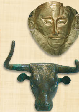
Sumer - Tête de taureau III e millénaire