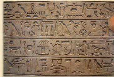
Égypte - Hiéroglyphes IV e - I er millénaires