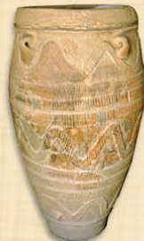
Civilisation minoenne Jarre (pithos) II e millénaire