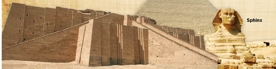
Grande ziggourat d'Ur - Mésopotamie III e millénaire