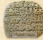
Sumer Écriture pré-cunéiforme III e millénaire