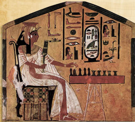
Égypte - Nefertari jouant au senet II e millénaire