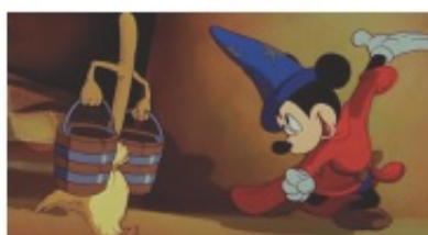
L'Apprenti sorcier / Musicopolis (Image ext du film Fantasia de Walt Disney, 1940)